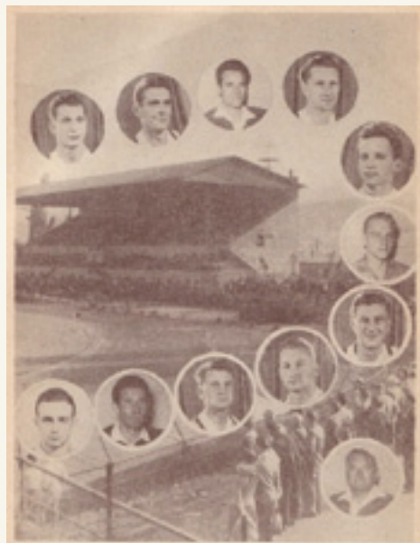
Az NB I. ötödik helyezettje és a vidék legjobb csapata 1959/1960-ban a DVTK.