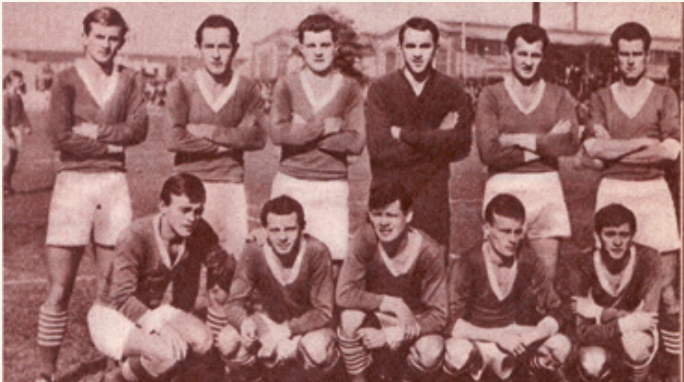
A DVTK a Ganz MÁVAG elleni csapata 1965-ben.