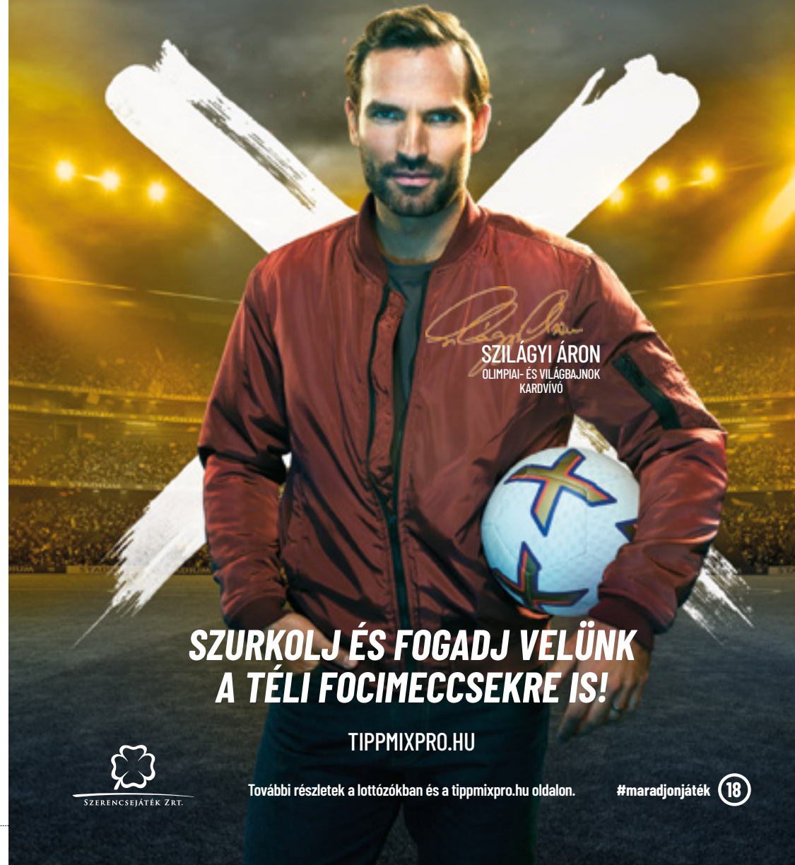
Szilágyi Áron SZILÁGYI ÁRON OLIMPIAI- ÉS VILÁGBAJNOK KARDVIVÓ

SZURKOLJ ÉS FOGADJ VELÜNK A TÉLI FOCIMECCSEKRE IS!